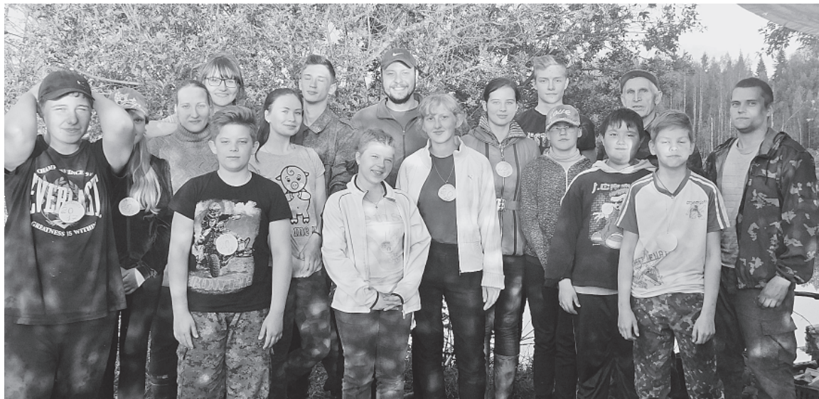
Участники экспедиции. Эти ребята мусорить не станут!